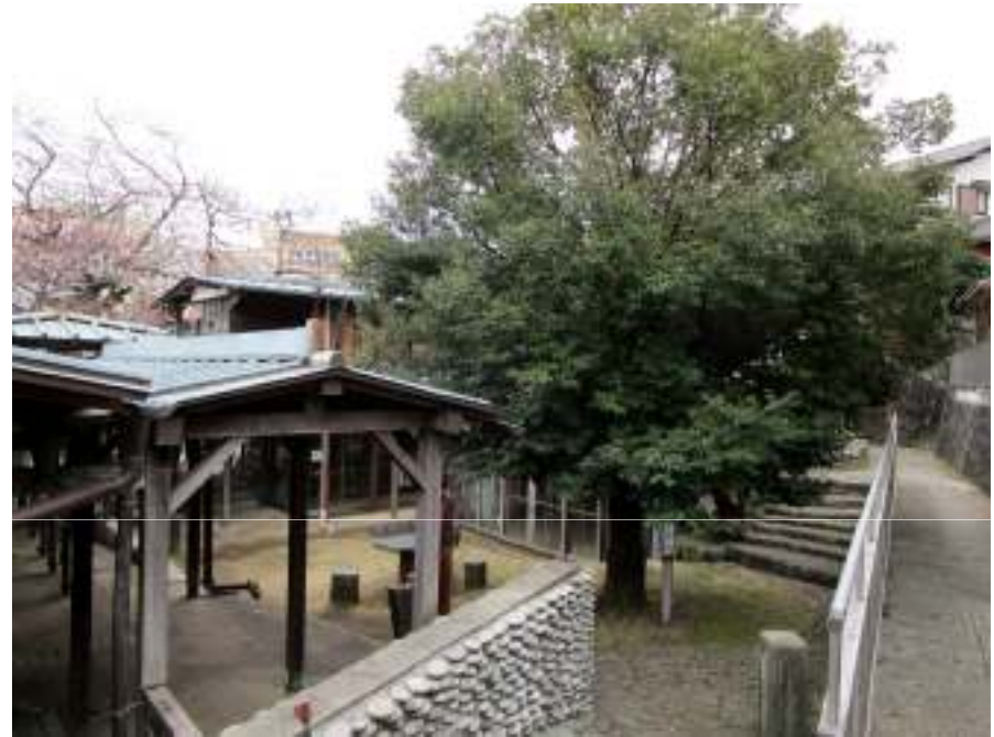
コミュニティ真鶴